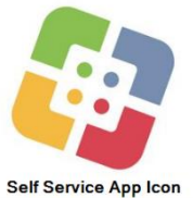
Self Service App Icon